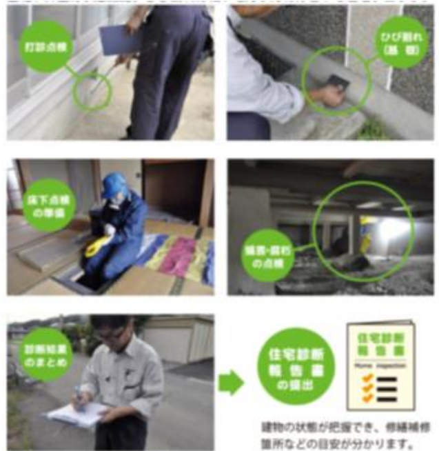
建物の状態が把握でき、修繕補修箇所などの目安が分かります。