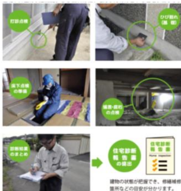
建物の状態が把握でき、修繕補修箇所などの目安が分かります。