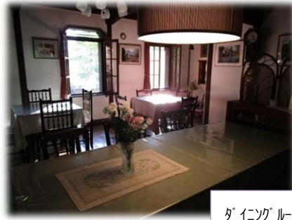
ダイニングルーム